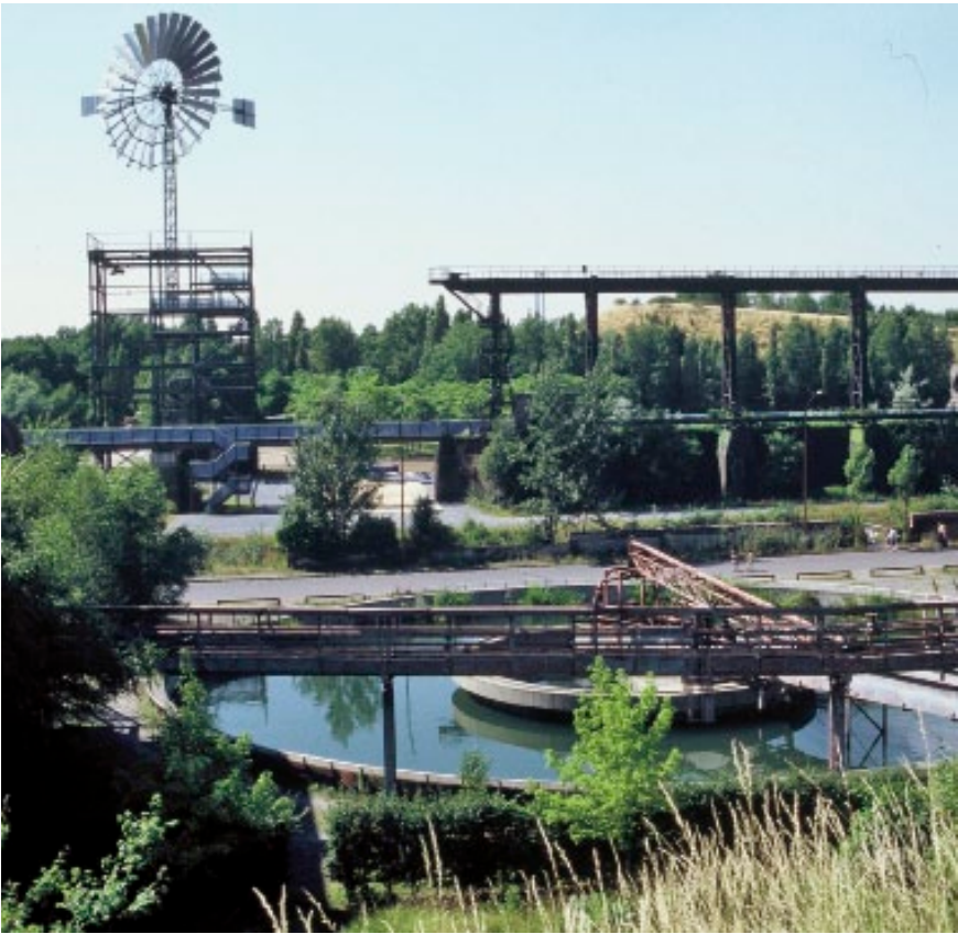
LAS VIEJAS depuradoras y balsas de tratamiento de aguas, son ahora los nuevos estanques

durante el siglo XIX, su pasado industrial durante el siglo XX y su uso actual como espacio de ocio y naturaleza.