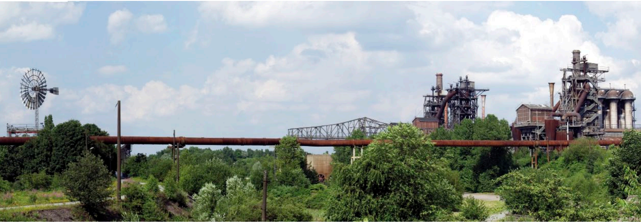
LOS ANTIGUOS edificios e instalaciones de los altos hornos, una vez recuperados forman parte del nuevo parque

El parque paisajístico de Duisburg está formado hoy, pasados más de diez años desde su finalización, por una serie de estratos heredados de su historia como zona agrícola