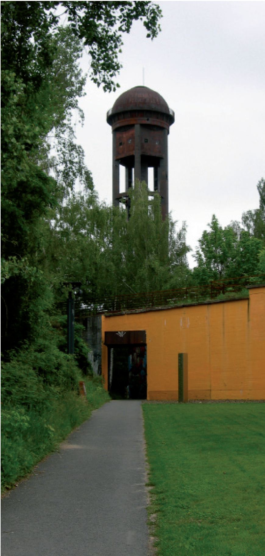
LA TORRE DE AGUA, sobresale por encima de las copas de los árboles y se convierte en un hito