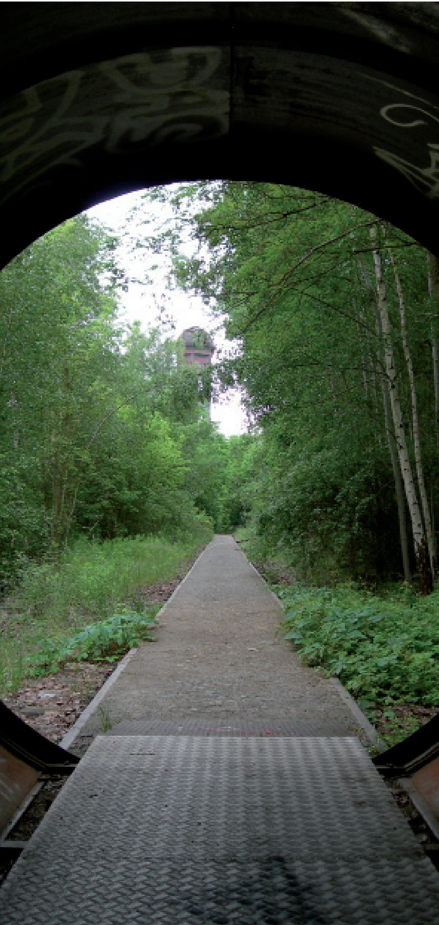
LOS ANTIGUOS elementos procedentes de las instalaciones ferroviarias, permanecen en el parque para recordarnos constantemente cual es la historia que ha dado origen a este lugar