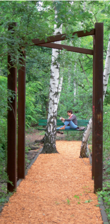
LOS CAMINOS del interior del bosque están cubiertos con una gruesa capa de madera de poda triturada formando una mullida alfombra, que absorbe por completo el ruido

El espacio ocupado hoy por el Natur-Park resulto inoperativo para su uso ferroviario debido al levantamiento del muro de Berlín. Con la reunificación, Südeglände volvió a ser considerada una zona de vías interesante, pero en aquel momento existían ya fuertes presiones sociales para salvar este espacio recuperado por al naturaleza. En 1995, debido a la urbanización de la zona de Postdamer Platz, se consiguió salvar el Natur-Park como compensación por las zonas de naturaleza destruidas en el centro urbano. La sociedad pública “Grün Berlin Park und Garten GmbH”, se encargó de la realización del proyecto del parque natural, una zona de utilización restringida al paseo, relajamiento y contemplación de la naturaleza. Para compensar la necesidad de usos de la